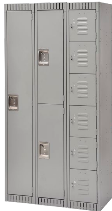
Cadres de calibre 16, corps et tablettes de calibre 24