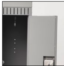
Portes à panneaux doubles, extérieur de calibre 20 et intérieur de calibre 24 (casiers de un et deux niveaux)