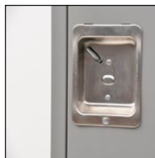
Poignées pour cadenas en retrait, en acier inoxydable Loquet magnétique assurant une fixation solide de la porte lorsque fermée